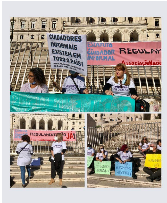
Concentração: Pela Defesa dos Direitos e Regulamentação Nacional do Estatuto do Cuidador Informal, 26 de Outubro | Escadaria Assembleia da